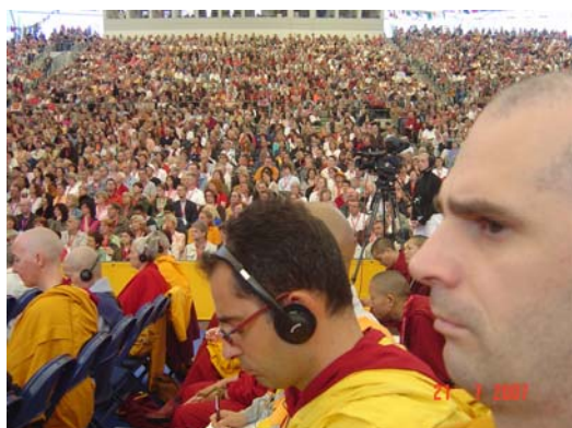
(Quang cảnh Pháp hội)

Năm ngày kế tiếp trong tuần Ngài giảng bằng tiếng Tây Tạng sâu vào giáo lý, qua 400 bài kệ của ngài Thánh Thiên Aryadeva. Ngày cuối cùng là lễ Điem Đạo (Quán Đảnh) Văn Thù Sư Lợi (rất tiếc ngày này tôi không tham dự được, vì phải theo xe buýt đi dự khóa Phật Pháp Châu Âu kỳ thứ 19 tại Thụy Điển).