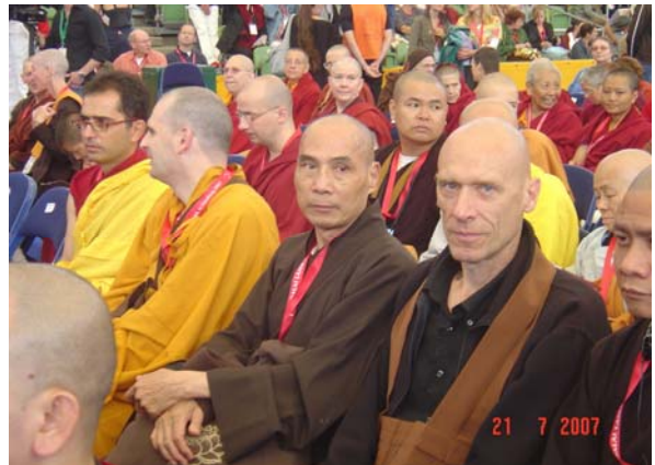
(quang cảnh chư Tăng)