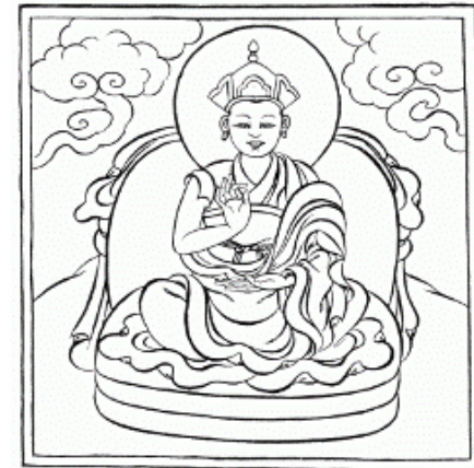
Tranh họa đại sư Tsele Nats'og Rangdrol được lưu trữ tại http://www.rangjung.com/authors/tsele-info.htm

về đạo pháp lấy lòng. Ngài nổi tiếng đức độ và đã đắc được hết tất cả các pháp của thế gian và siêu thế gian. Người ta nói, ngài có thể nắm gọn được hết những giáo pháp của tất cả các giòng truyền thừa, đặc biệt là giòng Kagyu và giòng Nyingma, dễ dàng như trong lòng bàn tay.