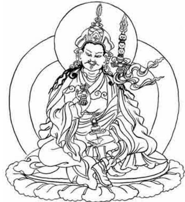
Tranh hoạ đức Liên Hoa Sanh Padmasambhava được lưu trữ tại http://www.mahayana.it/index1.html?nyingma.html

Người đó không ai khác hơn là Padmasambhava , một vị đại hành giả xuất thân từ xứ Uddiyana, vùng Tây-Bắc nước Ấn thời Cổ, ngày nay nằm giữa ranh giới lãnh thổ hai nước A-Phú-Hãn và Pakistan.