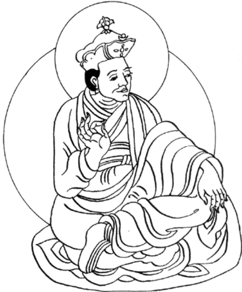
Tranh họa ngài Karma Lingpa thuộc bản quyền của Wisdom Publications Boston

đều rất chú tâm vào việc khai triển những hướng dẫn về Cõi Trung-Giới và giữ cho giòng truyền thừa của Cõi Trung-Giới không bị gián đoạn.