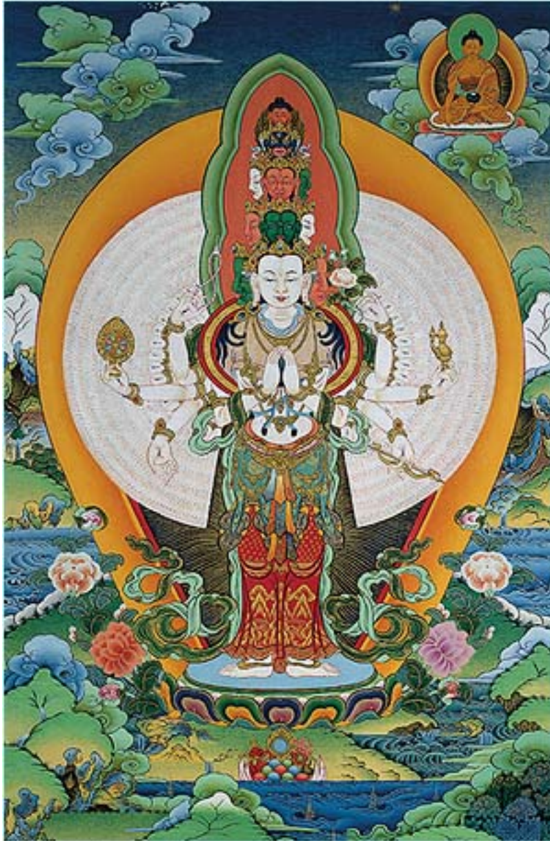
Tranh 'thangka' đức Thiên-Thủ Thiên-Nhãn Quán-Thế-Âm Avalokiteshvara

The Buddhist Art of Nick Dudka Thangka http://www.thangka.ru/gallery/ge_avalokiteshvara.html