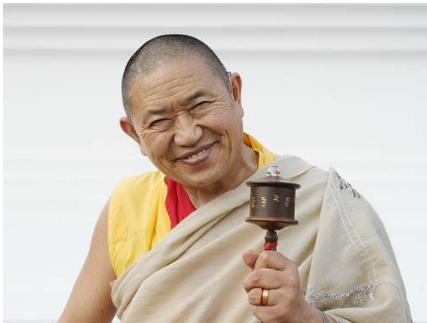
Garchen Rinpoche với Kinh Luân luôn luôn ở trên tay

Ngày 20 tháng Giêng Các Đạo hữu thân mến,