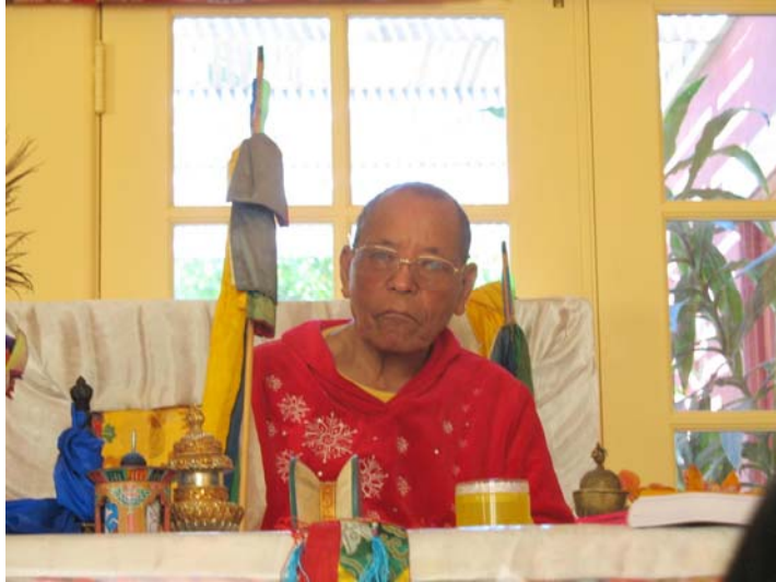
Lamasang năm 2006

Trong những năm vừa qua, tất cả các bạn, dù ở đâu trên khắp thế giới, đã mang lại sự hỗ trợ không thể tin nổi cho Lama Sang và quả thực cho tất cả những đề án của chúng tôi, và đã biểu lộ sự quan tâm hết sức sâu sắc đối với chúng tôi bằng mọi cách có thể có được. Thiện tâm của các bạn không thể phai nhòa và sẽ luôn luôn được ghi nhớ. Phù hợp với hoàn cảnh hiện tại, với tư cách là người đại diện của thân, ngữ và tâm của Đức Kusum Lingpa, vị guru tôn quý của chúng ta, tôi muốn nói lời cảm ơn chân thành, cảm ơn một trăm lần nữa, về thiện tâm của tất cả đệ tử của Lama Rinpoche, dù các bạn ở đâu trên khắp thế giới.