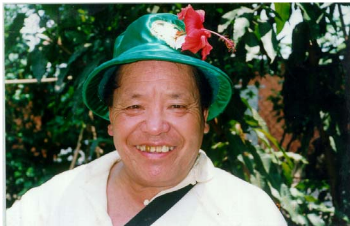
Đại sư Kusum Lingpa tại Việt Nam (năm 2000)

Trong những năm vừa qua, tất cả các bạn, dù ở đâu trên khắp thế giới, đã mang lại sự hỗ trợ không thể tin nổi cho Lama Sang và quả thực cho tất cả những đề án của chúng tôi, và đã biểu lộ sự quan tâm hết sức sâu sắc đối với chúng tôi bằng mọi cách có thể có được. Thiện tâm của các bạn không thể phai nhòa và sẽ luôn luôn được ghi nhớ. Phù hợp với hoàn cảnh hiện tại, với tư cách là người đại diện của thân, ngữ và tâm của Đức Kusum Lingpa, vị guru tôn quý của chúng ta, tôi muốn nói lời cảm ơn chân thành, cảm ơn một trăm lần nữa, về thiện tâm của tất cả đệ tử của Lama Rinpoche, dù các bạn ở đâu trên khắp thế giới.