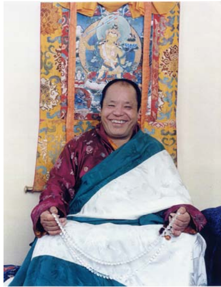
Đại sư Kusum Lingpa