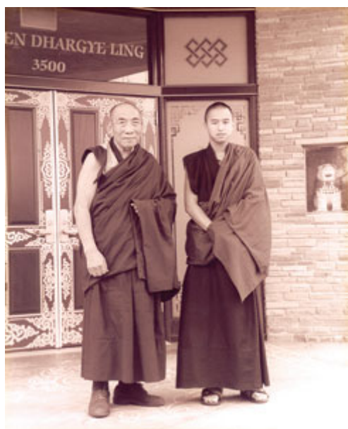
Hoà thượng Geshe-la và nhà sư Việt Nam Kusho

Trích báo xuân Việt Báo Tết Đinh Hợi, 2007 www.vietbao.com