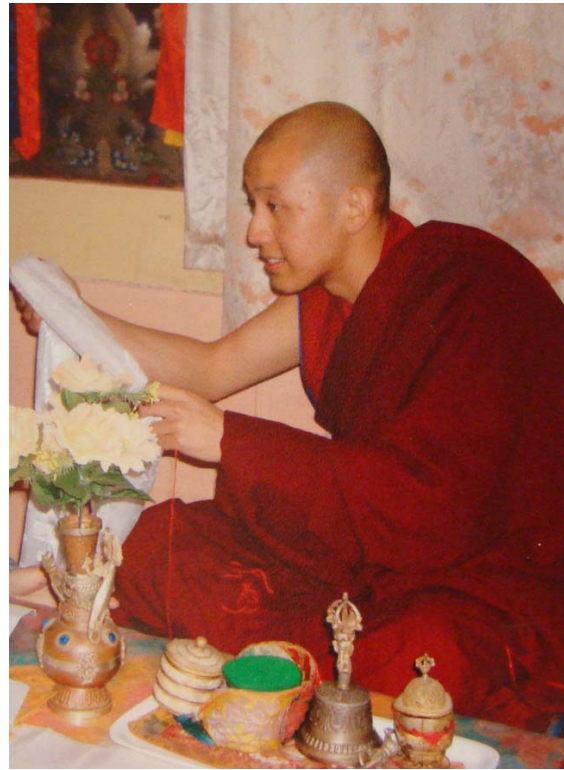
Ngài Kyabje Zong Rinpoche