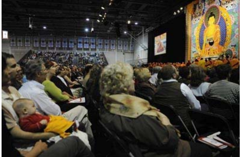
Công chúng lắng nghe đức Đạt Lai Lạt Ma giảng Phật pháp tại đại học American ở Washington ngày 10 tháng 10 năm 2009.

Đức Đạt Lai Lạt Ma nhấn mạnh đến tầm quan trọng của việc mọi người theo đuổi tín ngưỡng riêng của mình trong khi vẫn tôn trọng các tôn giáo khác. Ngài nêu ra sự khác biệt giữa niềm tin và sự kính trọng. Ngài nói rằng mỗi người phải có niềm tin duy nhất vào tôn giáo của mình (ngài nói điều này sẽ làm giảm bớt sự bối rối) nhưng sự kính trọng phải được thể hiện đối với mọi tôn giáo.